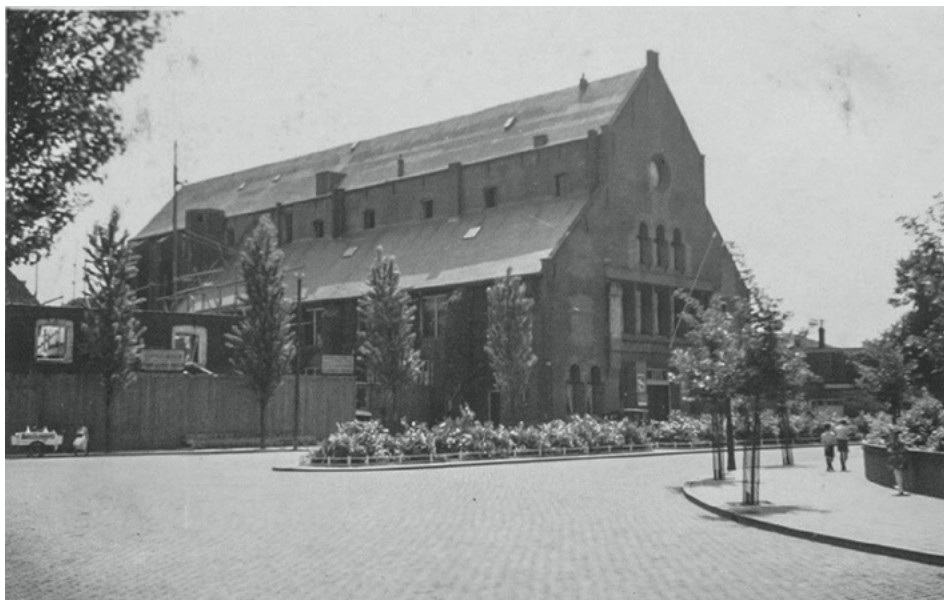
4. Het gebouw van het Provinciaal Genootschap, de voormalige Sint Jacobskerk, 1935. J.A.M. Roelands, coll. Erfgoed 's-Hertogenbosch, nr. 0045222.

De ontwikkeling van een provinciale bibliotheek en museumcollectie behoorde al sinds de oprichting tot de kerndoelstellingen van het Provinciaal Genootschap, vanuit de gedachte dat Noord-Brabant niet alleen ‘economisch achtergebleven’ maar ook ‘totaal vergeten’ was. 89 Waar het provinciaal bestuur zich bij de oprichting van het Genootschap committerde aan een jaarlijkse financiële bijdrage, zorgde de gemeente 's-Hertogenbosch voor de huisvesting van zijn collecties. 90 Doordat deze huisvesting vaak van tijdelijke aard was en zelden voldeed – jaar na jaar werd er geklaagd over lekkende daken en doorbuigende plafonds – werd in de twintigste eeuw naarstig naar ‘een in allen opzichten eigen huis voor het Genootschap’ gezocht. 91 Lang leek dit niet realistisch, door het ontbreken van een substantieel eigen vermogen. Dit veranderde toen de zoon van een van de oprichters het Provinciaal Genootschap in 1922 een bedrag van 110.000 gulden naliet. In 1924 werd het voorstel ingewilligd om de Oude Sint-Jacobskerk in 's-Hertogenbosch, die dienstdeed als Rijkskazerne maar zou worden ontruimd, tot een museum te verbouwen. 92 Hierbij bleken