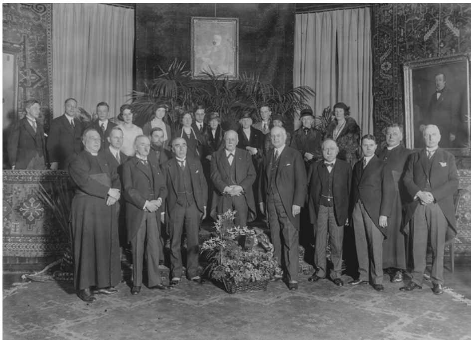
3. Viering van de tachtigste verjaardag van Alexander van Sasse van Ysselst in het Centraal Museum, 20 april 1932. Fotopersbureau Het Zuiden – coll. Erfgoed 's-Hertogenbosch, nr. 0022399.

de Eerste Wereldoorlog onderzocht. Een rol die Van Sasse van Ysselst op het lijf geschreven leek, als onafhankelijk figuur met een rechterlijke achtergrond, die op dat moment bovendien buiten het parlement stond. 73 Zijn afwezigheid in de Tweede Kamer duurde niet lang: in 1920 keerde hij terug, toen Loeff tot lid van de Raad van State werd benoemd en Van Sasse van Ysselst als eerste plaatsvervanger voor de kieskring 's-Hertogenbosch diens plaats innam. 74 De katholieke bladen spraken van rechtvaardigheid voor Van Sasse van Ysselst, 'aan wien de stembus een onrecht had gedaan', door 'misverstand en misvatting enerzijds, door zijn afkeer van reclamezucht anderzijds'. 75