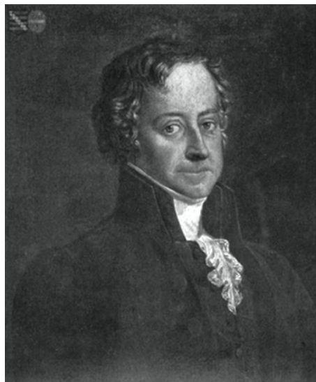
2. Schilderij van Leopold van Sasse van Yssel. Brabant-Collectie, Topografisch-Historische Atlas P/S 18.8.

Door zijn voorname rechterlijke en politieke posities stond Van Sasse van Yssel rond 1900 aan de top, of beter gezegd, in het centrum van het elitenetwerk van oostelijk Noord-Brabant. 13 Daarbij speelde ook het regionale verenigingsleven een belangrijke rol. Hier was Van Sasse van Yssel als een vis in het water: hij kende iedereen die ertoe deed, en iedereen kende hem. Als typisch lid van de aristocratische elite was hij prominent onderdeel van diverse sociëteiten en comités, met name in 's-Hertogenbosch. 14 Voor de Bossche elite vervulde het verenigingsleven een belangrijke rol als sociaal trefpunt. 15 Dit gold zeker voor Van Sasse van Yssel, die zoals gezegd nooit trouwde. Hierdoor had hij tot op hoge leeftijd 'veel van den student kunnen behouden': dagelijks wandelde hij na de gezamenlijke maaltijd met 'eenige eerbiedwaardigen' die hij nog kende uit zijn Leidse studietijd, 'met de jas over den arm, naar de Sociëteit, zooals zij dat, vijftig jaar geleden, óók zouden hebben gedaan'. 16