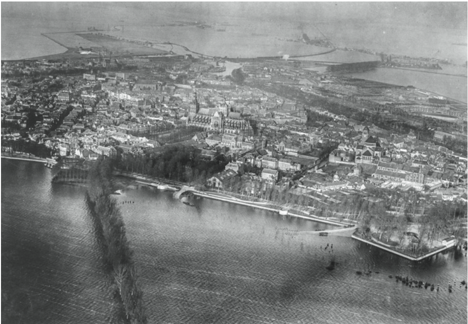
8. 's-Hertogenbosch tijdens een overstroming in januari 1926, gezien in noordwestelijke richting.

van de inwoners van het overstroomde gebied. Wanneer de kanonnen van Grave klonken, wisten de boeren dat zij voor het water moesten vluchten, waarna zich vanaf Cuijk tot voorbij 's-Hertogenbosch een nieuwe rivier van enkele kilometers breed vormde: de Beerse Maas. 177 Vooral na zijn terugkeer in de Tweede Kamer in 1920 werd het Van Sasse van Ysselts grootste strijdpunt om 'een einde te maken aan den onduldbaren toestand, dat een vierde gedeelte der provincie Noordbrabant opzettelijk wordt blootgesteld aan overstroming met het noodlottig gevolg, dat noch de landbouw, noch de handel en de industrie zich behoorlijk kunnen ontwikkelen'. 178 Dit had ongetwijfeld te maken met zijn positie als eerste voorzitter van waterschap De Maaskant, dat in 1921 werd opgericht ter uitvoering van de Maasnormalisatie, zodat de Beerse Maas uiteindelijk gesloten zou kunnen worden. 179 Hoewel deze rivierwerken al veel langer onderwerp van gesprek waren, duurde het tot de catastrofale overstromingen van nieuwjaarsdag 1926, waarvan grote delen van de Maasvallei in Limburg, Noord-Brabant en vooral Gelderland slachtoffer werden, dat de noodzakelijkheid van verandering ook in kabinetskringen duidelijk werd. 180