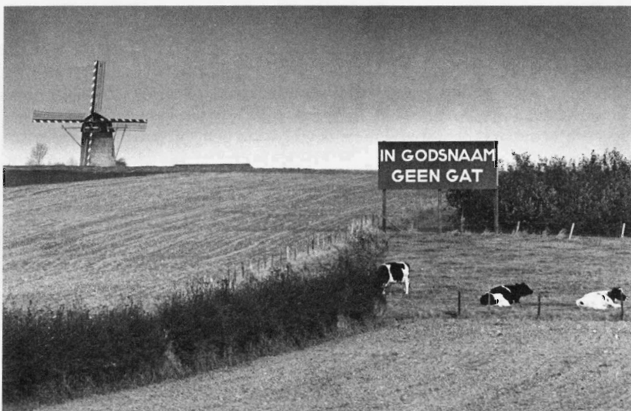
De Van Tienhovenmolen op het Plateau van Margraten, november 1978.