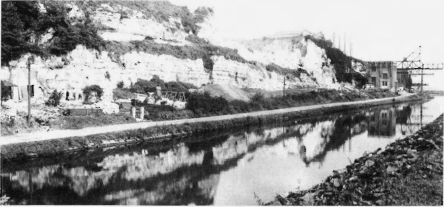
In afwachting van het definitieve besluit over de voorgenomen afgraving van de 'Coulisse', de zijwand van de Sint Pietersberg die de groeve afschermd tegen inkijk vanuit het Maasdal, werd al met de sloop van de huizen onderaan de wand begonnen. Foto ca. 1948. Uit: Van mergel tot cement, 70 jaar ENCI, 1926-1996 (Maastricht 1996).

worden beschermd tegen maatschappelijk ingrijpen, in dit geval de afgraving door ENCI. In de discussie over de Pietersberg werden deze argumenten meestal gecombineerd met culturele en historische, 34 wat de indruk geeft dat de natuurwaarden op zichzelf niet voldoende overtuigend werden geacht om de economische te ontcrachten.