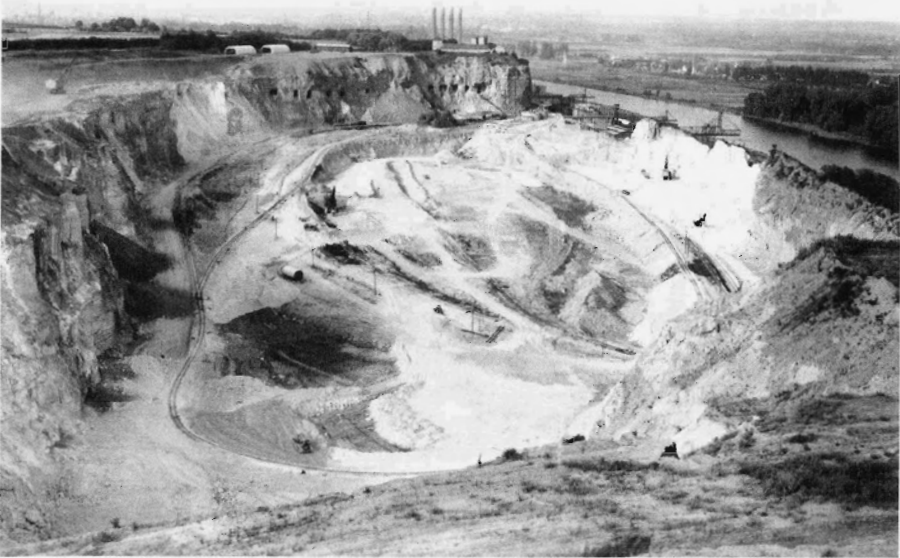
In de ENCI-groeve wordt plaats gemaakt voor de grote naoorlogse uitbreiding van de fabriek, ca. 1949. Uit: Van mergel tot cement, 70 jaar ENCI, 1926-1996 (Maastricht 1996).