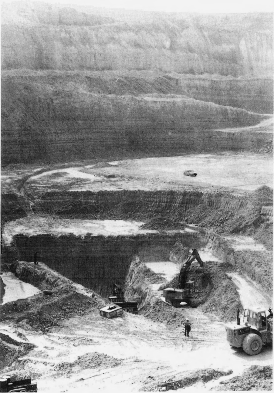
Aanleg van de proefput voor de diepwinning in de ENCI-groeve, ca. 1985. Uit: Van mergel tot cement, 70 jaar ENCI, 1926-1996 (Maastricht 1996).