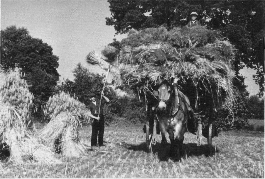
Een romantisch beeld van het boerenleven. Circa 1950.

algemene economische crisis, hooguit van een kortstondige terugslag als gevolg van de Korea-oorlog. Toch was het voor beleidsmakers evident dat vooral kleine boeren op de langere termijn weer in ernstige problemen zouden raken. Het kleine-boerenvraagstuk was in hun ogen geen conjunctureel maar een structureel economisch probleem.