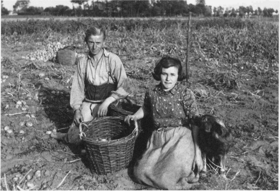
Jonge boer en boerin tijdens het aardappelen rapen op Rosveld. Circa 1950.