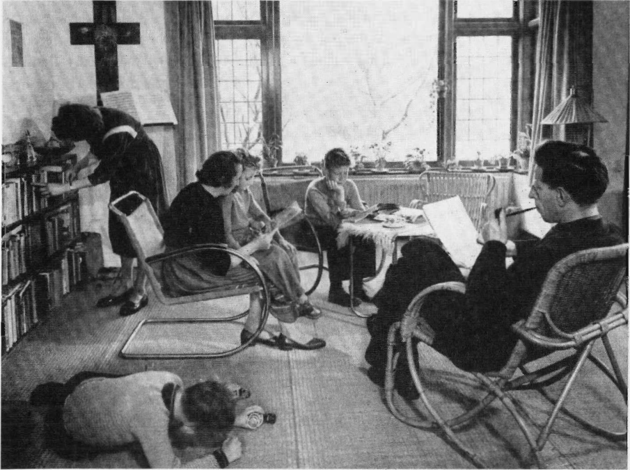
Een modern boerengezin in huiselijke kring. Uit: Jaarverslag van landbouw en visserij 1958.

Juist omdat de agrarisch-sociale voorlichting een algemeen karakter had in de Limburgse streekverbeteringen, werd het gewicht van de huishoudelijke voorlichting groter. Agrarisch-sociale voorlichting en huishoudelijke voorlichting convergeerden op sommige terreinen, wat niet vreemd was omdat in beide gevallen de voorlichting aan en over het gezin een belangrijke plaats innam. In het 'Land van Gulpen' liepen beide voorlichtingsvormen aanvankelijk zelfs volledig door elkaar heen. Doordat de huishoudelijke voorlichting zo centraal kwam te staan nam de betekenis van de boerin als intermediair in het moderniseringsproces toe. Goed en wel beschouwd vervulde zij drie rollen in het bedrijf: boerin, huisvrouw en gezinsverzorgster.