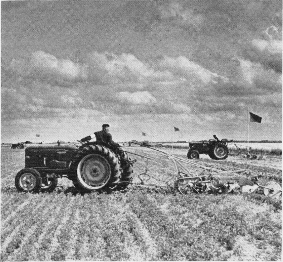
Een tractorwedstrijd. Uit: J.M. Schijen, Agrarische voorlichting (Den Haag 1961).