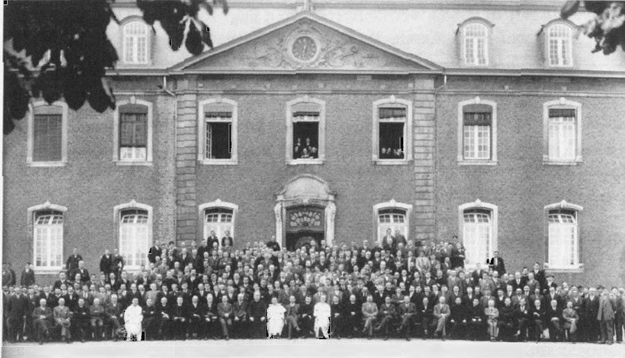
Geschaard rond voorman Poels. Groepsfoto van de deelnemers aan een van de Rolducse Studieweken in de jaren 1930.

de hoogdringende maatschappelijke reorganisatie een leidende rol durfde spelen, kon de Sociale Studieweek tot ver over de grenzen heen invloed hebben en de katholieke partijen in Nederland, België en Duitsland konden, hoewel een minderheid, van doorslaggevend belang zijn. 62 Op studieweken zet men gemakkelijk een hoge borst op.