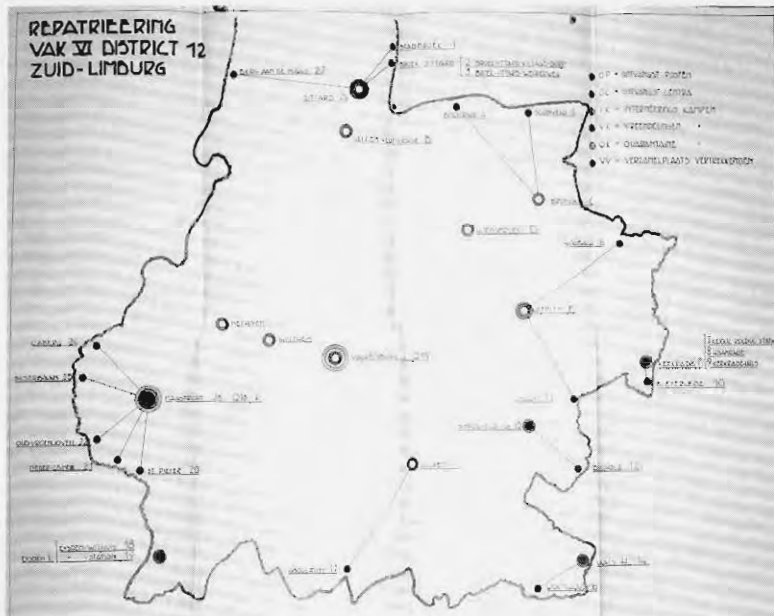
Kaart van Zuid-Limburg. Aangemerkt zijn de diverse opvangcentra. Archief RAL, Repatriëring, vak VI, District 12, Zuid-Limburg. Er waren opvangcentra in Maastricht, Heerlen, Sittard, Valkenburg, Mamelis/Vaals, Rimburch, Kerkrade, Hoensbroek, Gulpen, Brunssum, Eijsden en Simpelveld. Het gebied (Vak VI) telde 15 ontvangstcentra, 62 verblijfskampen, 5 noodziekenhuizen en 2 sanatoria.