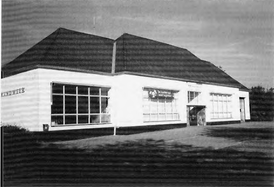
Het voormalig schoolgebouw in Vilt, waar stateloze joden te werk werden gesteld, dient nu als brandweerkazerne en opslagplaats voor gemeentewerken.