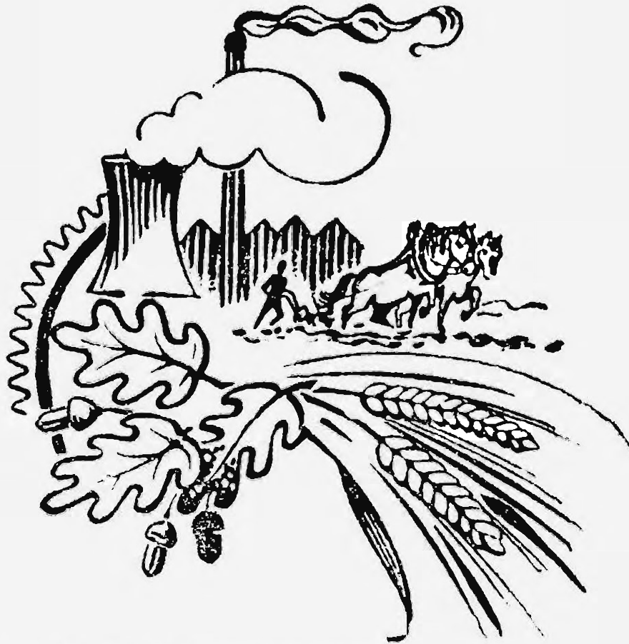
Logo van het Sociaal Historisch Centrum voor Limburg uit de jaren 1950-60.