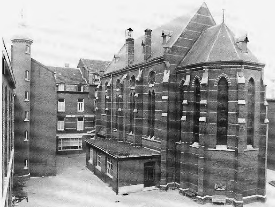
De neogotische kapel met sacristie van het voormalige klooster van de Zusters van het Arme Kind Jezus doet dienst als depot en leeszaal van het SHCL. Foto ca. 1975 (coll. SHCL).

niet de geijkte reactie van de arbeidende klasse op de industrialisatie. Alleen waar de sociale politiek van de lokale elite mislukte, sloeg de socialistische variant aan. 38