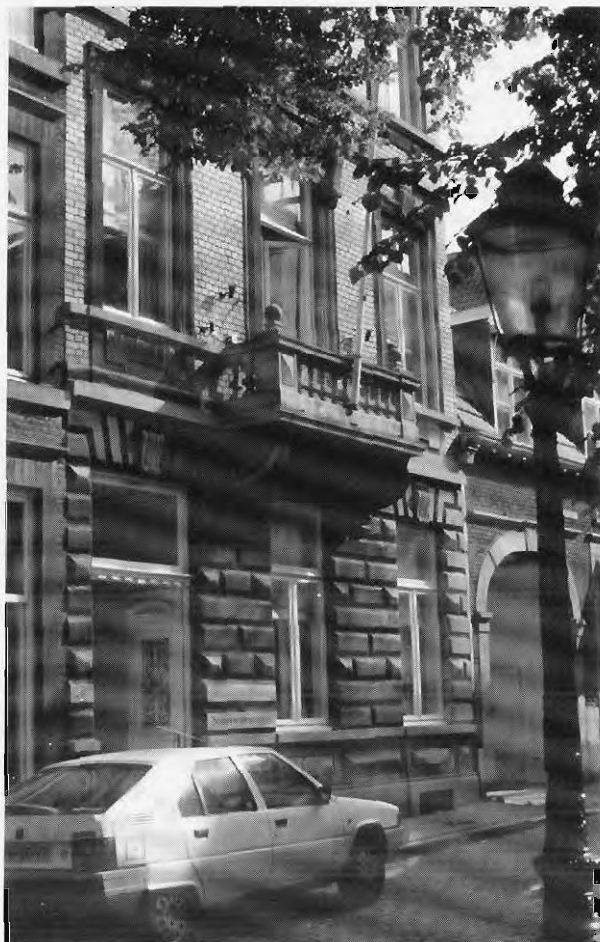
Het SHCL was van 1962 tot 1974 gevestigd in het pand Onze-Lieve-Vrouweplein 4 te Maastricht. Foto 1986.

was gepromoveerd. 26 Ook voor kleinere publicaties met de omvang van een artikel was een publicatiemogelijkheid aanwezig in de vorm van de Studies over de sociaal-economische geschiedenis van Limburg .