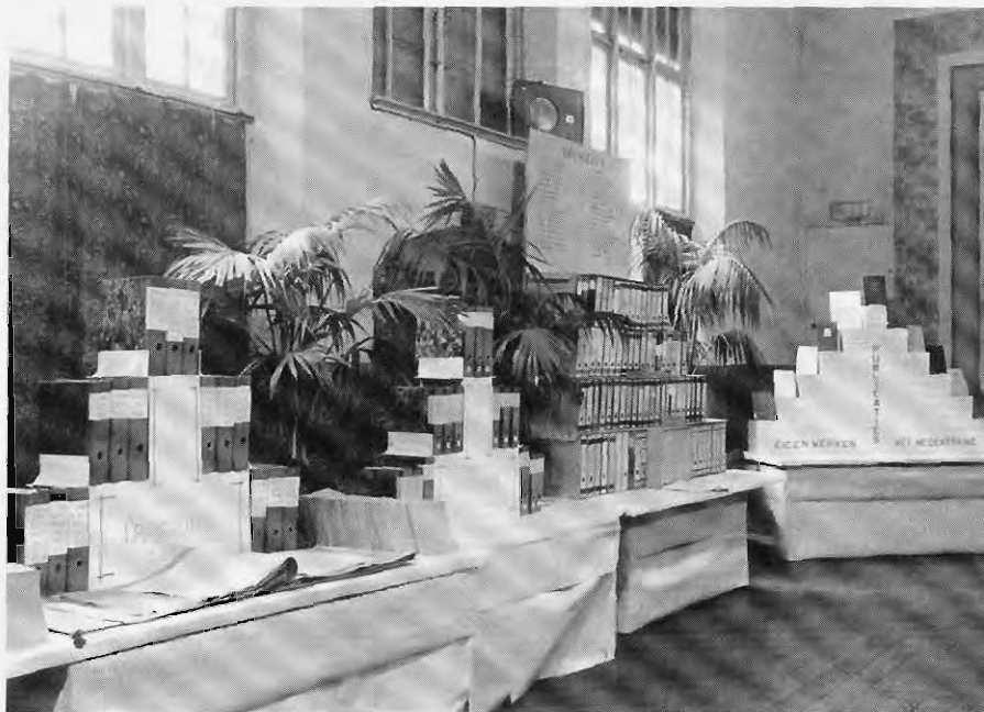
In 1954 bij het eerste lustrum van het SHCL werd een expositie georganiseerd, waarin de gehele collectie van het instituut werd gepresenteerd. Foto 1954 (coll. SHCL).

de provincie Limburg in het Koninkrijk der Nederlanden. Die integratie werd in de tijd van de Eerste Wereldoorlog bezegeld toen Limburgse kopstukken een hoofdrol gingen spelen in de landelijke politiek. Voorbeelden daarvan zijn de politici W.H. Nolens en Ch. Ruys de Beerenbroeck ter rechter- en de sociaal-democratische voorman W. Vliegen ter linkerkant.