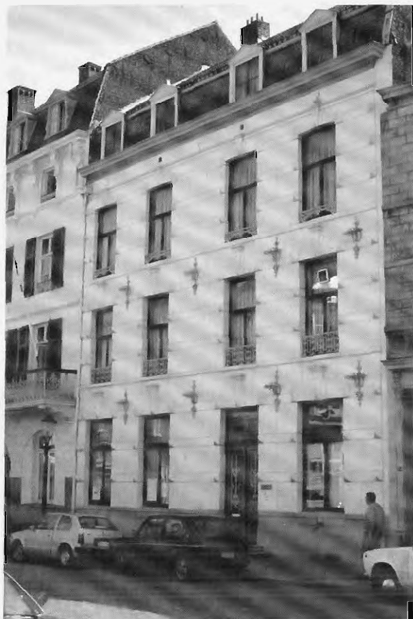
Sedert 1974 is het kantoorpand van het SHCL gevestigd aan de Boschstraat 73 te Maastricht. Foto 1986.

Als er maar serieuze studies beschikbaar zijn, dan is het helemaal niet zo'n probleem om Limburg een plekje onder de zon van Kleio te bezorgen. Dat blijkt ook uit het volgende voorbeeld. Agrarische geschiedenis is altijd een zwaartepunt geweest in het onderzoek van het SHCL. Zo liepen Jansen en Philips voorop met het bewerken van bronnen die in de rest van het land weinig gebruikt werden, zoals de tiendregisters en Franse enquêtes van rond 1810. De resultaten van dit onderzoek hebben keurig een plaats gekregen in de vaderlandse geschiedenis, toen een paar jaar geleden van de hand van dr Jan Bieleman een handboek verscheen over de agrarische geschiedenis van Nederland. 34 Dus laten we niet te snel roepen dat Limburg er altijd bekaaïd vanaf komt in de Nederlandse historiografie. Dat we in de schoolboeken weinig of niks over Limburg lezen is natuur-