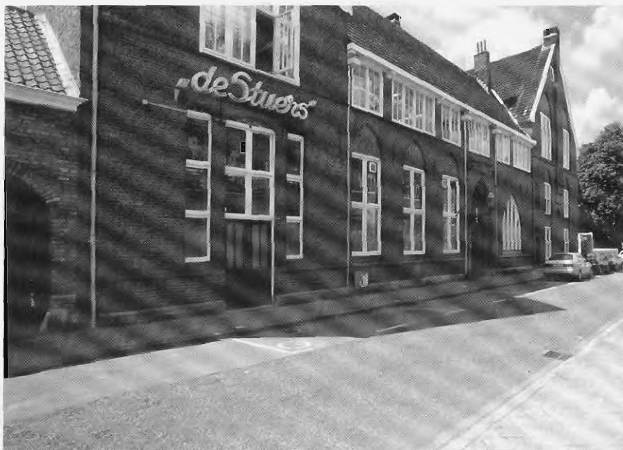
Het Victor de Stuershuis te Maastricht. Foto 1999.

telefoon gegaan, waardoor veel in het vage blijft. 16 Naar het schijnt konden de Staatsmijnen zich ook niet helemaal verenigen met één van de statutaire doelstellingen van het Centrum. 17 Naast het verzamelen en inventariseren van bronnenmateriaal over het sociale en economische leven in Limburg in heden en verleden, was het ook de bedoeling daarover te publiceren. De Staatsmijnen vonden dat daarmee de grenzen van het bedrijfsbelang werden overschreden. Geschiedschrijving was in principe geen taak van de Staatsmijnen. Later is DSM daar gedeeltelijk op teruggekomen, getuige de uitgave van het boek van dr Messing over de mijnsluiting. 18