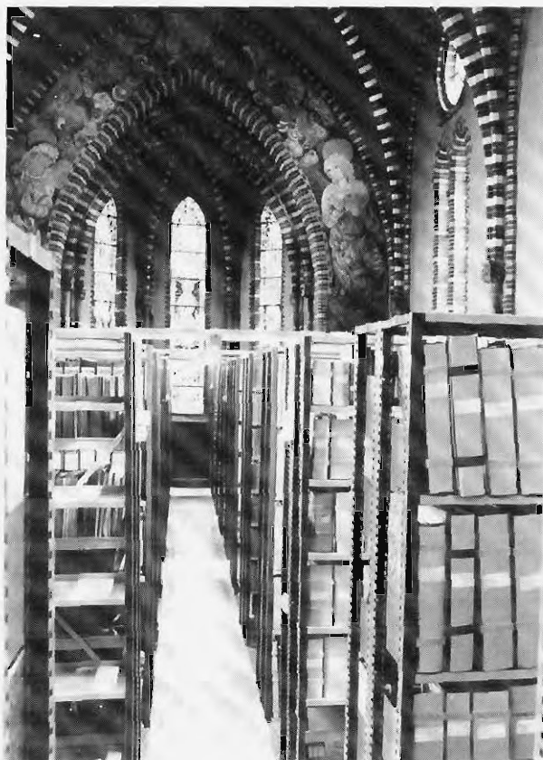
De voormalige kapel werd in 1974 als archief- en bibliotheekdepot door het SHCL ingericht. Foto ca. 1975.

gaan vergelijken? Ook boven de Moerdijk houdt de daling van de huwelijksvruchtbaarheid geen gelijke tred met de economische modernisering en dat kwam niet door de pastoor, want in Groningen heb je bijna geen katholieken. Het kwam ook niet door de dominee. Hillebrand laat zien dat de mentaliteit van regionale populaties onvoldoende gemeten wordt door alleen naar religie te kijken. De weerstand tegen neomalthusiaanse praktijken heeft niet alleen te maken met kerkelijke gezindte. De auteur vermoedt het bestaan van specifieke, streekgebonden gedragscodes die zorgen dat de motivatie tot gezinsplanning op een geheel eigen wijze in gedrag wordt omgezet. De gebieden waar deze gedragscodes hun sporen hebben nagelaten, worden min of meer afgebakend door de dialectgrenzen. Hier ligt een prachtige uitdaging voor nader interdisciplinair onderzoek naar demografische gedragspatronen in Limburg, waarbij ook de dialectologie ingeschakeld kan worden. 40