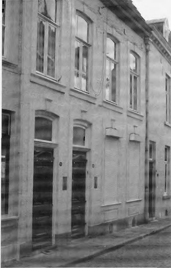
Van 1952 tot 1962 was het SHCL gehuisvest in het pand Kapoenstraat 19 te Maastricht. Foto 1986.