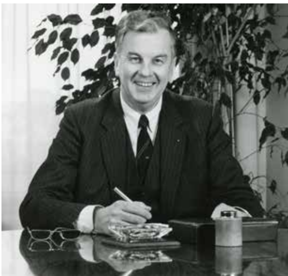
President-directeur Bert Kaptein.

te staan. Het zette andermaal veel kwaad bloed en kwam de reputatie van het bedrijf in Maastricht wederom niet ten goede. 74