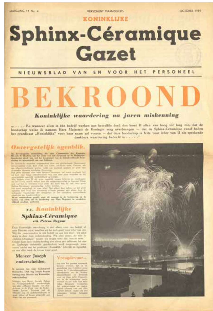
Sphinx-Céramique Gazette, jg. 11, no. 11, oktober 1959. Voorpagina met tekst ‘Bekroond. Koninklijke onderscheiding na jaren miskennis’.