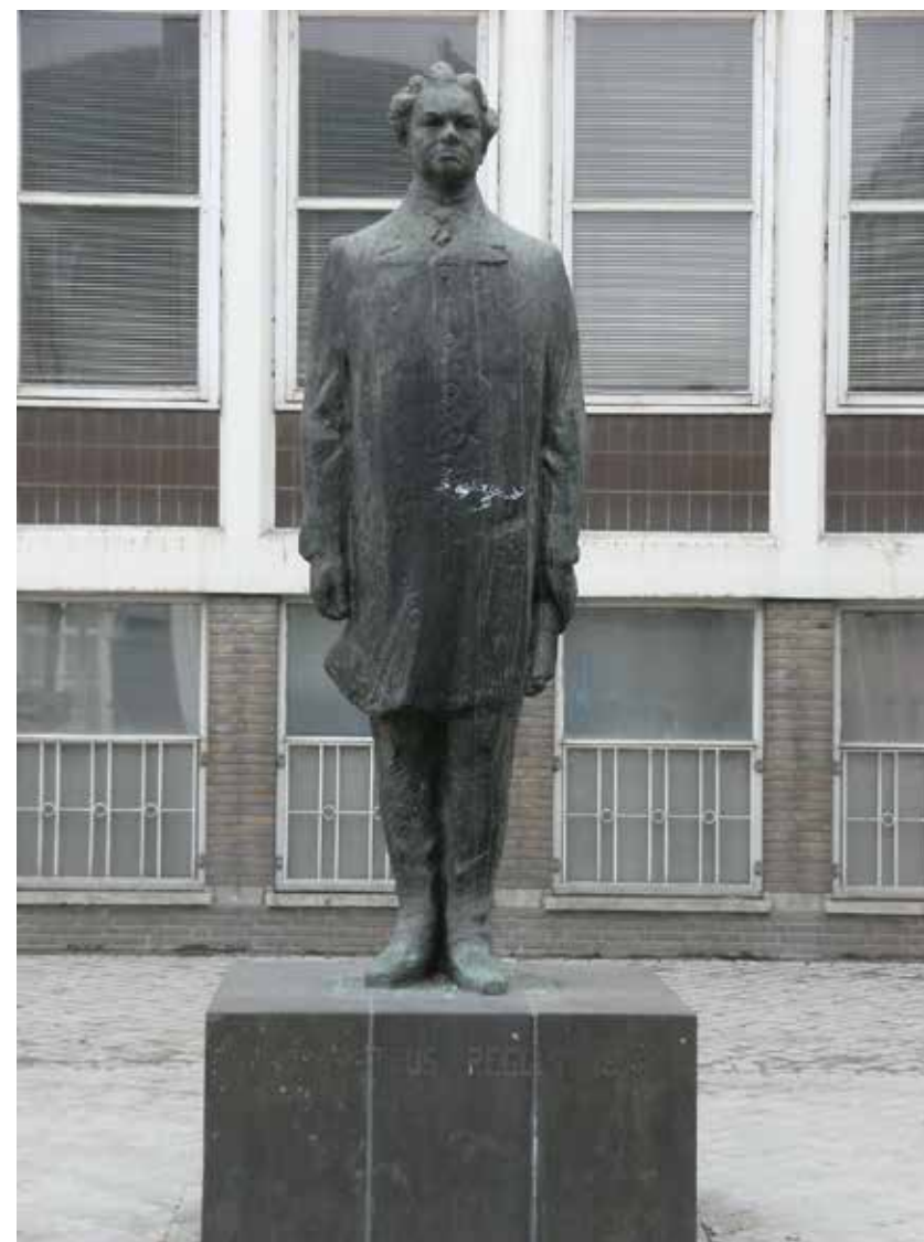
Standbeeld Petrus Regout aan de Boschstraat te Maastricht (2009).

Hoe gevoelig de naam Regout ook begin jaren 1990 nog lag in Maastricht, bleek toen het CDA in 1993 in de gemeenteraad voorstelde de doorgaande avenue in de nieuwbouwwijk Céramique in stadsdeel Wijk te vernoemen naar Petrus Regout. De PvdA verklaarde zich tegen: te voorbarig, de tijd was er nog steeds niet rijp voor. Pakweg anderhalf decennium later was ook de PvdA om. Petrus Regout geldt in die kringen inmiddels als schoolvoorbeeld voor innoverend ondernemerschap in de maakstad Maastricht.