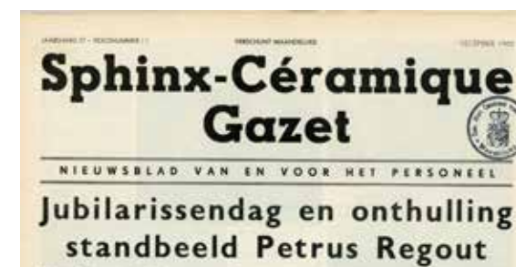
Sphinx-Céramique Gazet, jg. 17, no. 11, december 1965.