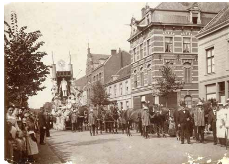
Historische optocht en praalwagen met gipsen beeld van Regout, Maastricht 1905.

nachtarbeid van kinderen tot grote verontwaardiging geleid. Ook de ontslaggolven in de crisisjaren 1930 speelden een rol bij de negatieve beeldvorming over De Sphinx. De animo om bij ut groet fabriek te gaan werken liet te wensen over, zo constateerde de leiding van het bedrijf in de jaren 1950. 14