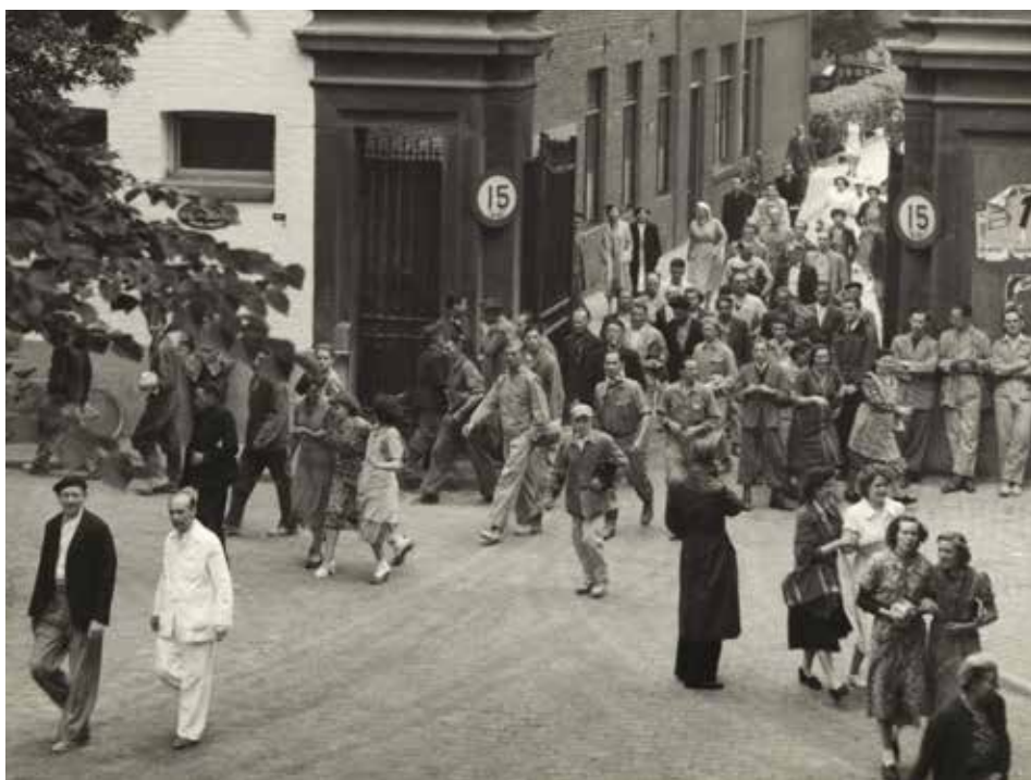
Aan het einde van de werkdag. Arbeiders verlaten de fabriek van de Sphinx, c. 1950.