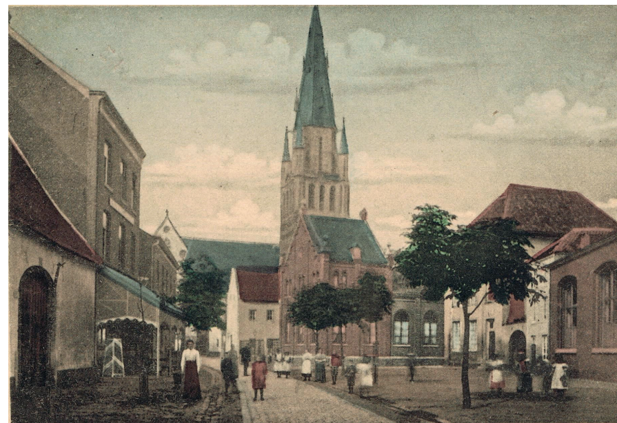
Het Kloosterplein van Sittard omstreeks 1900, met geheel rechts een deel van het verenigingslokaal van de FXV. De ursulinen bouwden er een etage op. Ingekleurde prentbriefkaart