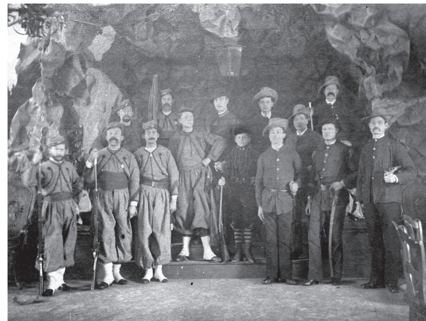
De toneelgroep van de FXV bij een opvoering van Le Fils du Solidaire

Vrouw van het H. Hart bezochten. Aan het station werden de pelgrims stevast opgehaald door de geestelijkheid en musicerende 'Xaverianen'. 69 Met de fanfare ging het goed, maar zij kostte ook veel geld vanwege de instrumenten, bladmuziek en muzieklessen. 70 Zo lang de vereniging bestond, was de fanfare present. Zij luisterde tal van processies, festiviteiten en jubilea op. De muzikale begeleiding van uitvaarten van (ere)leden van de vereniging werd in oktober 1881 gestaakt. 71