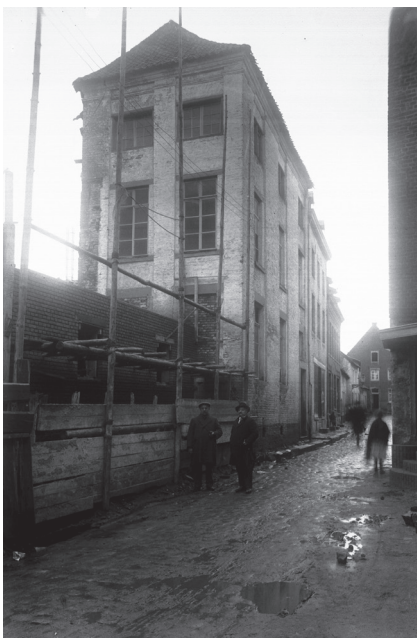
De 'Oude Voogdij' in de Helstraat te Sittard, dat gedurende enige jaren het verenigingsgebouw van de FXV was

Pater Kouwenbergh pleitte voor maatregelen tegen dergelijk optreden. Of er van hogerhand ingegrepen is, verklappen de bronnen niet.