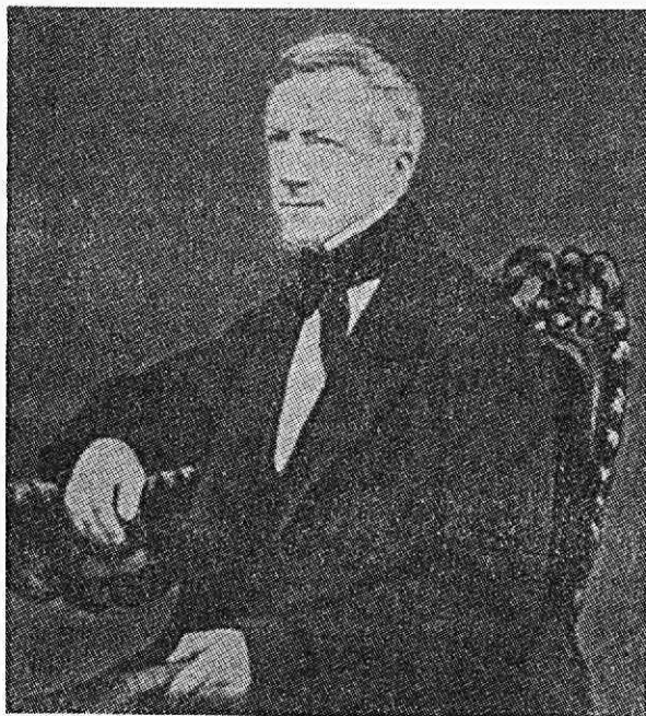
Groen van Prinsterer

Er was in de Bataafse tijd tegenover de primitieve ontwikkelingssituatie nog geen behoefte aan, of impuls tot theorievorming, zomin als die er tijdens de Oude Republiek was geweest. Toen met de helaas ongeweten schade dat de enige grote rechtstheoreticus die zich, behalve met de wijsgerige vragen over het wezen van de staat, ook bezig heeft gehouden met de concrete staatstaak, met name beschouwingen had gegeven van grote precisie over de aard, inrichting en werking van het onderwijsstelsel, over het recht op en de verantwoordelijkheid voor het onderwijs, met een uitgewerkt patroon van schooltypen, waarin de docentenopleidingen en de technische scholen bijzondere aandacht kregen. Deze geleerde was Johannes Althusius, rector magnificus van de Nassause universteit Herborn, die in 1603 een fundamenteel werk publiceerde – Politica methodice digesta – met daaraan toegevoegd zijn rectoraatsrede uit hetzelfde jaar: oratio panegyrica de necessitate utilitate et antiquitate scholarum – dat het schoolwezen twee eeuwen frustratie had kunnen besparen. Het enige dat hieruit is doorgedrongen, zijn enkele uit de tekst van Althusius geknipte adagia. Een er van staat op de gevel van de latijnse school in Kampen: Seminarium ecclesiae et reipublicae armamentarium , Kweekplaats der Kerk en wapensmidse van de Staat.