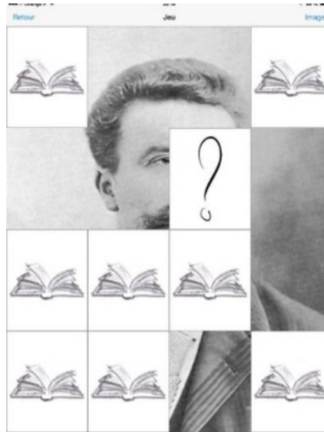
Fig. 4. Jeu du portrait avec Maupassant.

à une question dont la solution est donnée le lendemain) et du portrait, particulièrement populaire (le portrait d'un auteur se dévoile à mesure que l'internaute répond correctement à des questions masquant son visage). De la sorte, l'application intègre un procédé de gamification favorable aux appropriations en tout genre (Robert et Ayerdi-Martin), même s'il reste sommaire comparé aux scénarios policiers sur fond de storytelling type Cluedo , ou à des expositions virtuelles aux allures de jeu vidéo ( fantasy.bnf.fr ).