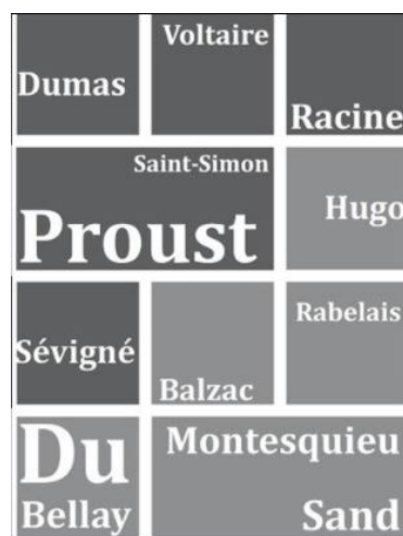
Fig. 1. Mosaïque des classiques sur le blog, détail de untexteunjour.fr

recettes des téléchargements les aident à couvrir les dépenses de fonctionnement. 3 Un Texte Un Eros date de 2014. Son utilisation traduit sa particularité : elle est consultée massivement l'été, saison où la sensualité s'exprime plus librement (!), et les jours fériés à l'occasion des grandes fêtes du calendrier au cours desquelles l'internaute dispose d'un long week-end. Les textes les plus licencieux séduisent quelques avertis, sans doute ravis d'appartenir à ce groupe confidentiel. A contrario , l'application Un Poème Un jour (2015), qu'on pourrait croire à tort plus élitiste en raison de la réputation dont jouit la poésie, attire des lecteurs de tous bords, gagnés par la renommée de géants parmi les classiques (Baudelaire, Rimbaud, etc. ) : elle est téléchargée quotidiennement. Sans doute le format des textes poétiques, plus courts et plus denses que les textes de prose, contribue-t-il à ce succès. L'application Un Texte Une Femme a été lancée en mars 2020 à la faveur de la Journée internationale des droits des femmes et du vaste mouvement en faveur de la reconnaissance des femmes comme figures de pouvoir ; elle remporte un succès notable (1 à 2 téléchargements par jour, quelques pics).