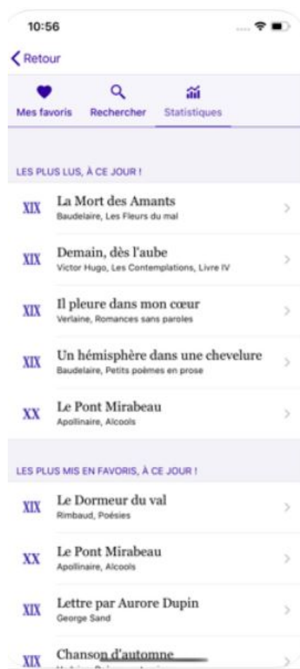
Fig. 2. La fonctionnalité « favoris » d'Un Texte Un Jour. Capture d'écran sur apps.apple.com

son propre panthéon selon une dynamique de fragmentation, reconfiguration et personnalisation propre aux appropriations contemporaines du patrimoine (Casemajor Loustau). La cohorte des écrivains des XVIII e et XIX e siècles occupe une place privilégiée dans ce panorama, avec une prédilection appuyée pour le genre romanesque et les textes du XIX e siècle, conformément à un certain tropisme scolaire d'ailleurs. 6 D'autres fonctionnalités permettent également à l'internaute de choisir cette fois ses favoris, de façonner son panthéon, et de le « partager » avec sa communauté (Doueihy). Le modèle anthologique proposé, parce qu'à géométrie variable, se prête ainsi aux appropriations personnelles, même si la voix de S. Sauquet reste prégnante. UTUJ propose d'ailleurs à ses utilisateurs de constituer des anthologies personnalisées à offrir. Mais à étendre ainsi le périmètre des classiques que chacun peut élire à son panthéon personnel à l'aune de ses propres critères, que reste-t-il de leur universalité et du canon ? Le développement d'UTUJ tente ainsi de concilier la normativité collective instituée avec la valorisation de l'expérience et du goût des individus, guidés par des influenceurs culturels divers.