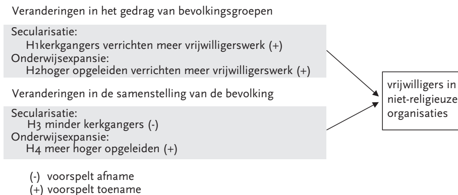
Figuur 1 Hypothesen ter verklaring van het relatieve aantal vrijwilligers in niet-religieuze organisaties in Nederland

Voor de onderhavige studie hebben we de gegevens van deze jaren samengevoegd tot een databestand dat na uitsluiting van ontbrekende gegevens 11.598 respondenten bevat.