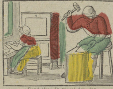
Goud slaan ik geheel den dag Schoon ik er niet veel van overhouden mag. Je bats de l'or constamment Et j'en gague peu cependant.