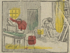
Wij binden Boeken groot en klein Ten dienste van het algemeen. Nous relierons livres nouveaux et vieux Et les conservons propres et beaux.