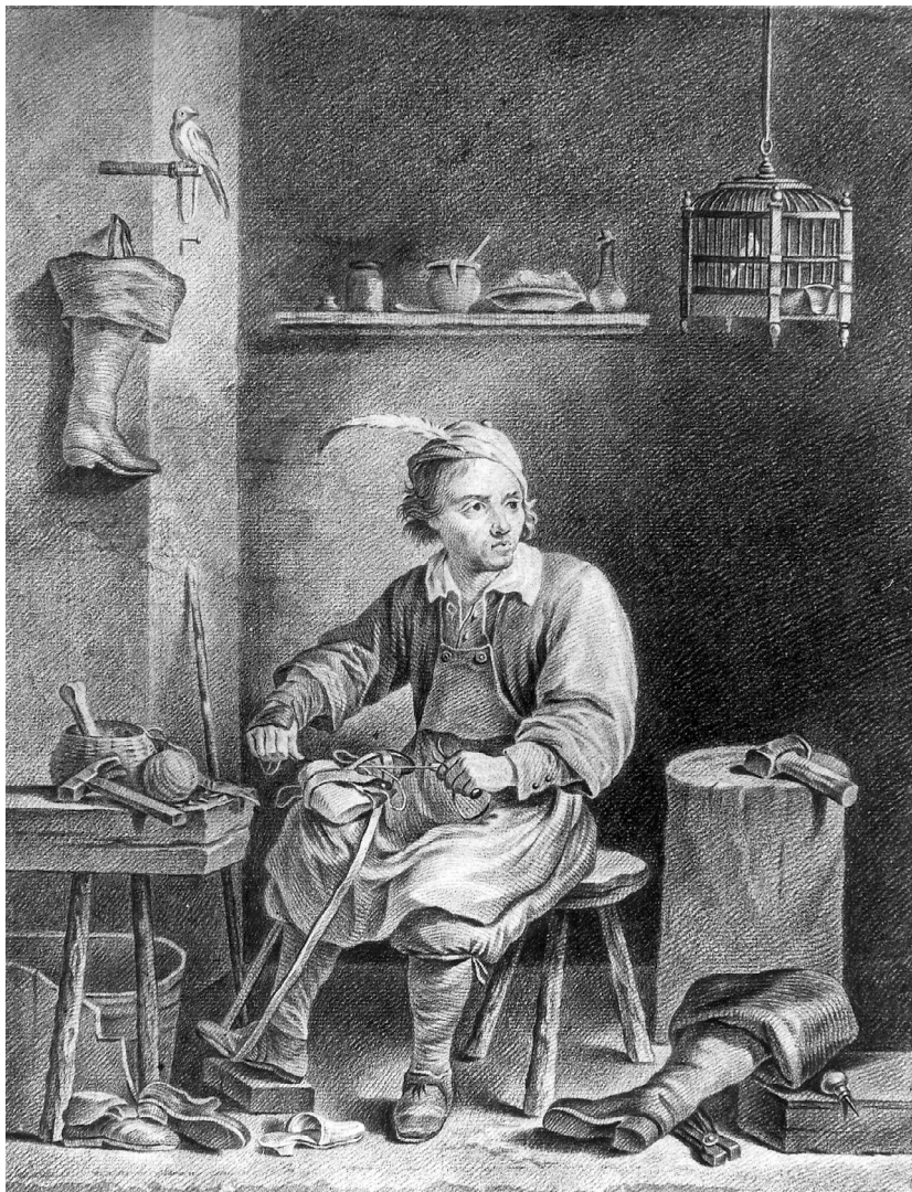
Illustratie 2 Een schoenlapper

(bron: onbekende tekenaar, achttiende eeuw. Steinmetzkabinet Brugge. https://balat.kikirpa.be/object/106617 )