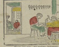
Koem bij ons wy maken Schoenen Vreuglijk met alle sinnen. Nous faisons d'excellentes chaussures Vreugz faire prendre vos mesures.