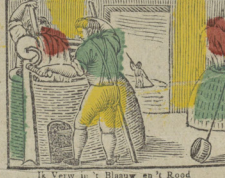
Ik Verw in 't Blaauw en 't Rood Voor 't afgaan is 't geen goed. Je teins en Bleu et Rouge parfois Mes contres ne changent point.