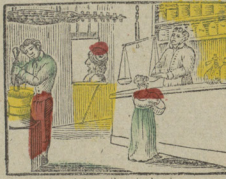
Niet Apothekery houd ik u in het leven Anders zoudt gij wij getoegt moeten heven. Dans un Pharmacie vous trouvez toujours Des remèdes qui prolongent vos jours.