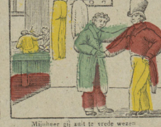
Mijnheer gij ant te vrede wezen Uw kleed zal worden oerall geprezen. Votre habit, Monsieur vous est beau Je vous assure il n'y manque.