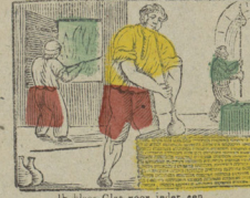
Ik Blas Glas voor ieder een Doch blaas ik geen glase heen. Je Blas des verres divers Mais je ne fais point de veux.