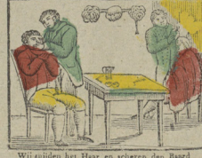
Wij snijden het Haar en scheren den Baard In onze hand is een ieder vervaard. Nous rasons barbe et coupeux cheveux Entre nos mains chacun est peureux.