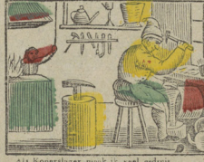
Als Koperlager maak ik veel geluk Ik hoor mij zelfs niet in huis. Chaudronnier, quand je suis à l'ouvrage Je fais un terrible tapage.