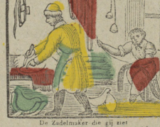
De Zadelmaker die gij ziet Werkt vrolijk en kent geen verdriet. Vous voyez ici le Bourrelier C'est un précieux ouvrier.