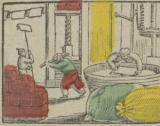
Van lappen maken wij papier, En verkopen het niet dier. De lappes je fais du papier C'est fort singulier.