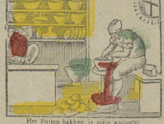
Het Potten bakken is mijn ambacht Het welk over al word gesacht. Je suis un Potter renommé Et mon art est fort estimé.