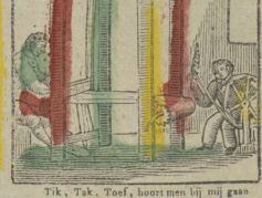
Tik, Tak, Toef, hoort men bij mij gans Ik weve alijd aan. Tan tu pans, tan tu pans, Je suis un bon Tisserand.