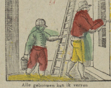
Alle gebouwen kan ik verren Niemand kan mijn kunste derven. Je mets en couleur toutes les maisons Qui sans cela suraient l'air de prisons.