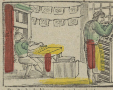
De Boek-drukkers met oplettendheid Begeren zich tot hunne beoogdheid. Les Imprimeurs travaillent assidûment Chacun à son ouvrage différent.