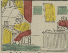
Geschriften in allerlei talen Graveer ik op alle metalen. Je grave avec goût et fidélité Pour le présent et la postérité.