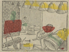
Wij geven Kliekou, bim, bam, bon Die zoo hart klinken als 't kanoon. Nous fondons des cloches dont le son Est aussi fort que celui d'un Canon.