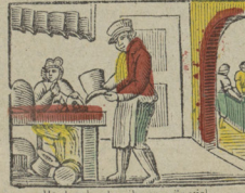
Hoedemaker ben ik van mijn atelier En verkoop die zeer civiel. Je fabrique des Chapeaux Et les vends à bon et heurt.