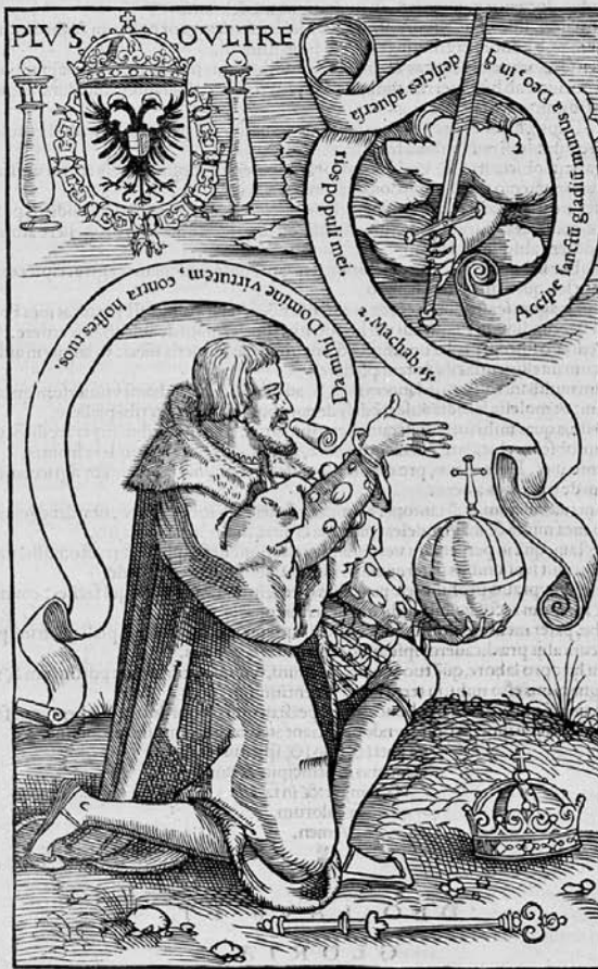
Afb. 1 De Habsburgse vorst Karel V (1531). De financiële autonomie van de steden in de Nederlanden werd in de vijftiende en zestiende eeuw bedreigd door de centraliseringspolitiek van de Bourgondische en Habsburgse vorsten (Rijksmuseum Catharijneconvent Utrecht).