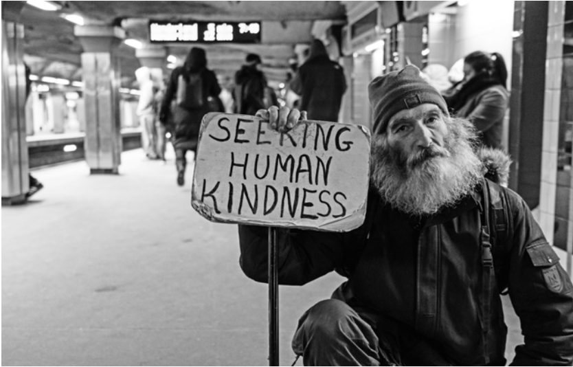
Illustratie 2 Sociaal en economische historici hebben tonnen expertise in huis over diverse actuele thema's, waaronder de groeiende welstandsverschillen, de vluchtelingencrisis en de opmars van populistische partijen. Helaas slagen we er niet in om met onze kennis te wegen op de beleidsvorming (bron: © Matt Collamer, Unsplash.com, uit de serie Seeking Human Kindness by Reading Harbor (ed.)).

karakter van deze waardevolle initiatieven overstijgen. Ik meen dat we dit kunnen doen door de vier voorstellen te implementeren die ik in dit essay kort toelicht, namelijk (a) een diversifiëring van onze communicatiestrategie, (b) de gedeeltelijke introductie van duo-jobs, (c) een verbeterde samenwerking met het bedrijfsleven en (d) de oprichting van een expertisecentrum dat bruggen bouwt tussen historici en partners van buiten de universiteit.